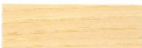
Incoloro / Mate