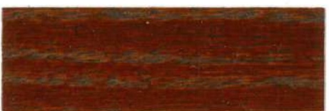
Caoba / Satinado