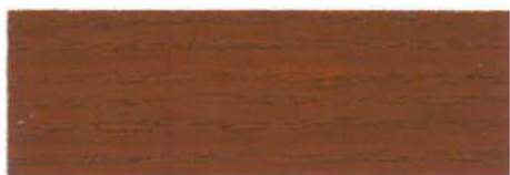
Caoba / Satinado