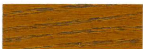
Roble / Satinado