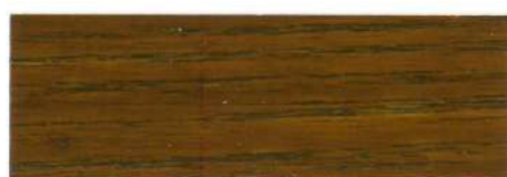
Nogal / Brillante