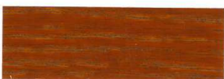
Caoba / Brillante