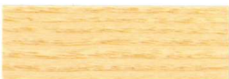
Incoloro / Brillante

Estas muestras están aplicadas a pistola sobre chapa de madera de fresno. El color puede tener variaciones según el tipo de madera y el grosor de la capa.