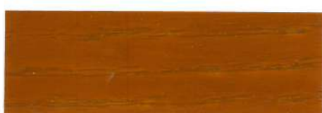
Pino / Brillante