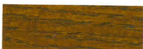
Roble Francés / Satinado