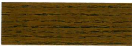
Nogal / Brillante