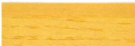
Incoloro / Brillante