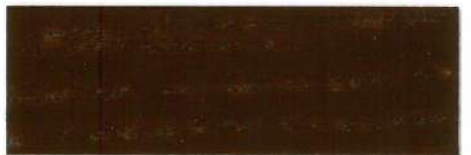
Palisandro / Brillante