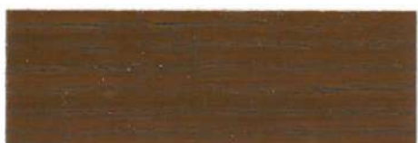
Teca / Satinado