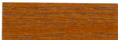
Pino viejo / Satinado