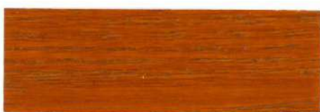
Teca / Brillante