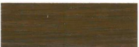
Nogal / Satinado