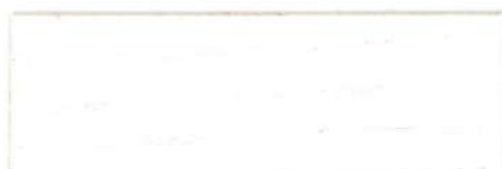
Blanco / Satinado