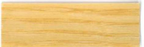
Incoloro / Brillante