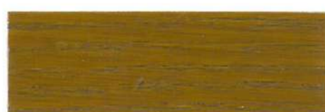
Roble / Satinado