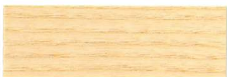
Incoloro / Satinado