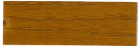
Roble / Brillante