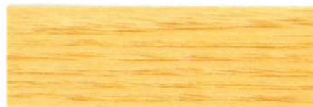
Incoloro / Satinado