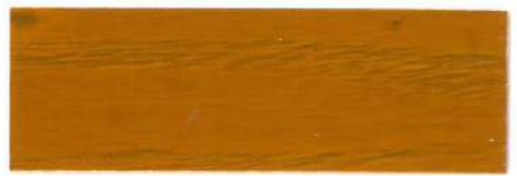
Castaño / Brillante