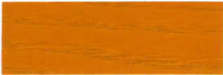
Cerezo / Brillante