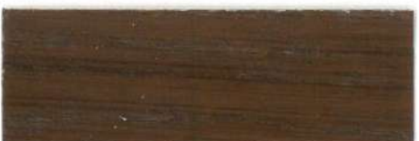
Palisandro / Satinado