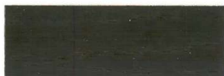
Nogal oscuro / Satinado