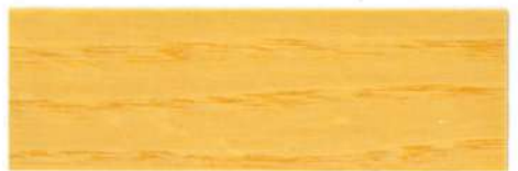
Incoloro / Brillante