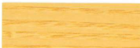
Incoloro / Satinado