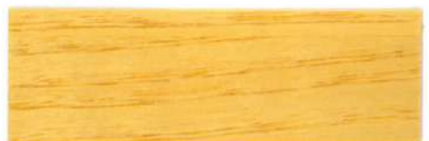
Incoloro / Brillante