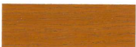
Pino / Satinado