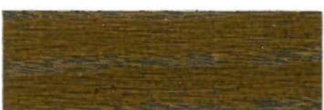
Nogal / Satinado