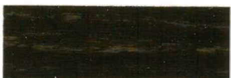
Nogal oscuro / Satinado