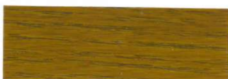
Roble / Brillante