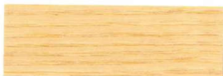
Incoloro / Brillante