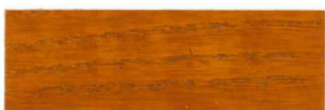
Pino Miel / Satinado