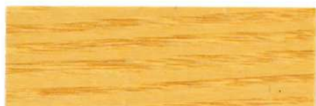
Incoloro / Satinado